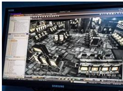
Kamerový systém je složený z analogových i digitálních kamer.

Naposledy tu byla třeba CIA, a ti agenti rozdávají takové medaile. Nevím, co to znamená, ale vypadalo, že je to podle nich pocta. Tak si to vždycky vezmu, poděkuju a pak jdu na eBay a kouknu, jestli to má nějakou cenu (smích). Každopádně se o naši technologii zajímají nejen kasina, máme nejmodernější kamerový a dohledový systém současnosti.