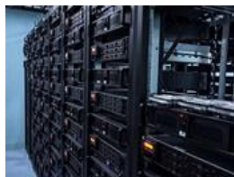
Servery ukládají terabajty videí (dřív podobnou práci zastávalo několik stovek VHS rekordérů).

Velkou, každého samozřejmě prověřujeme. Ale to nestačí. Všichni také procházejí testy a tréninkem. Kromě toho školíme naše kontrolory (supervisors), aby odhalili probíhající podvody a jakékoli nekalosti.