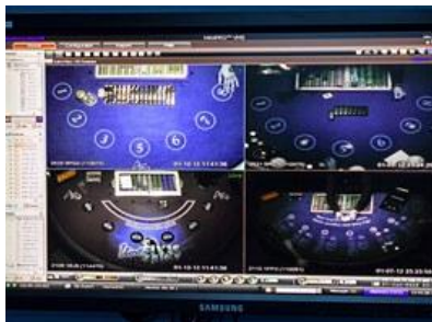
Záběr na jednotlivé stoly