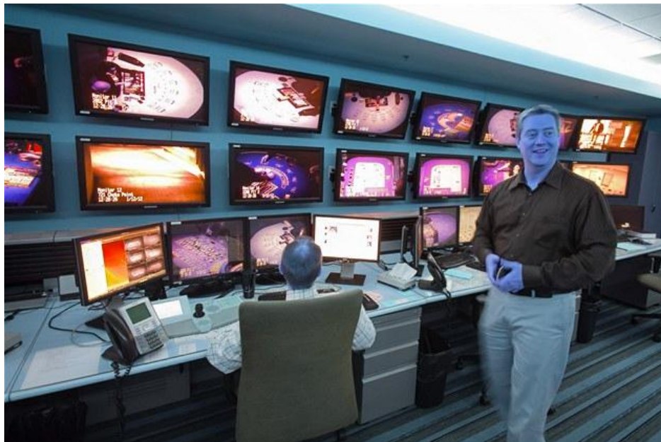
Dohledové centrum (Surveillance Center) v kasinu Aria, Las Vegas